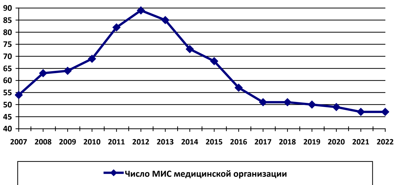
Рис. 1. Динамика числа различных типов МИС медицинской организации

Например, на рис. 1 представлена динамика числа различных МИС медицинской организации по годам. До 2012 года, т.е. до начала создания ЕГИСЗ (Единой государственной информационной системы в сфере здравоохранения), наблюдается неуклонный рост таких систем, а затем – достаточной резкий спад с последующей относительной стабилизацией. Тут есть над чем подумать.